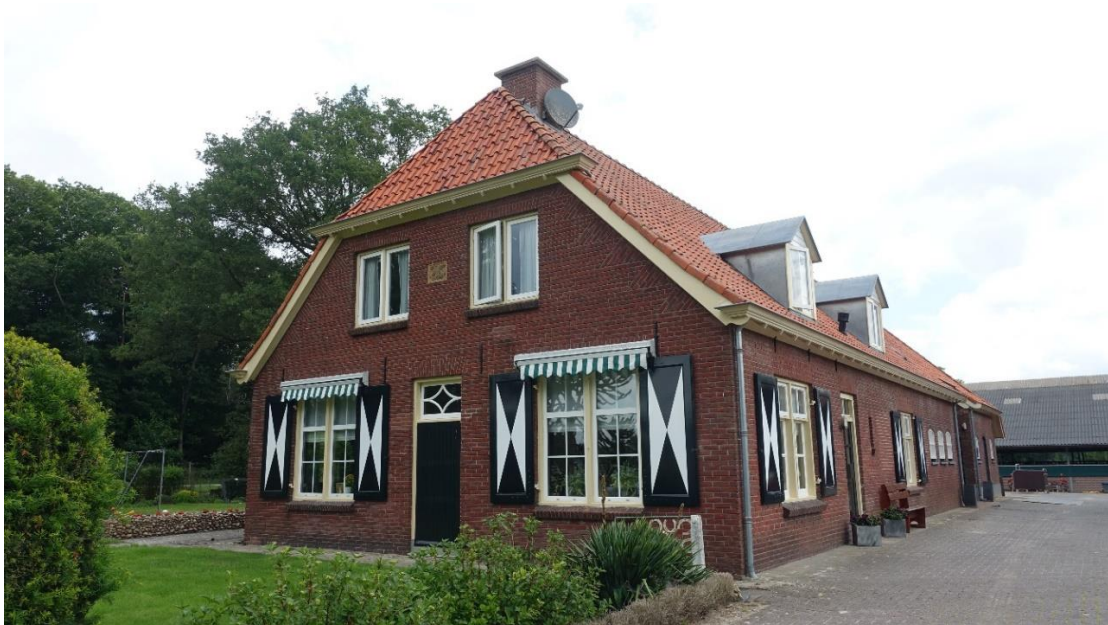
Boerderij Lochemseweg Markelo