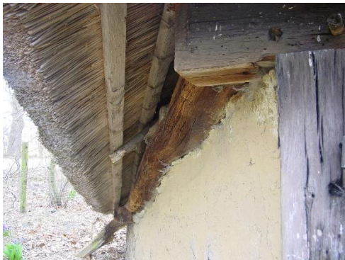
schaapskooi, Leusmansweg Markelo Rijksmonument.

Er is een subsidieverordening voor gemeentelijke monumenten in de gemeente Hof van Twente. Het gaat hier om een budget van 35.000 euro. In deze verordening zijn regels opgenomen omtrent het aanvragen en uitkeren van subsidiegelden op restauratie en/of onderhoudswerkzaamheden voor instandhouding van het gemeentelijk monument. Voor rijksmonumenten bestaan andere subsidieregelingen.