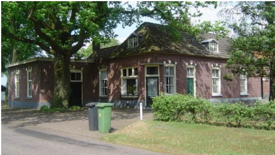
Pand Worsinkweg 5 in Markelo, m.b.t. eventuele toevoeging lijst RCE.

De Erfgoedcommissie heeft een duidelijke taak en functie binnen de gemeente. Zoals gezegd besteedt de commissie veel tijd aan het afhandelen van bouwvragen van monumenten. Daarnaast verricht de Erfgoedcommissie een aantal diensten op verzoek van de gemeente. Hieronder een opsomming van een aantal activiteiten in chronologische volgorde: