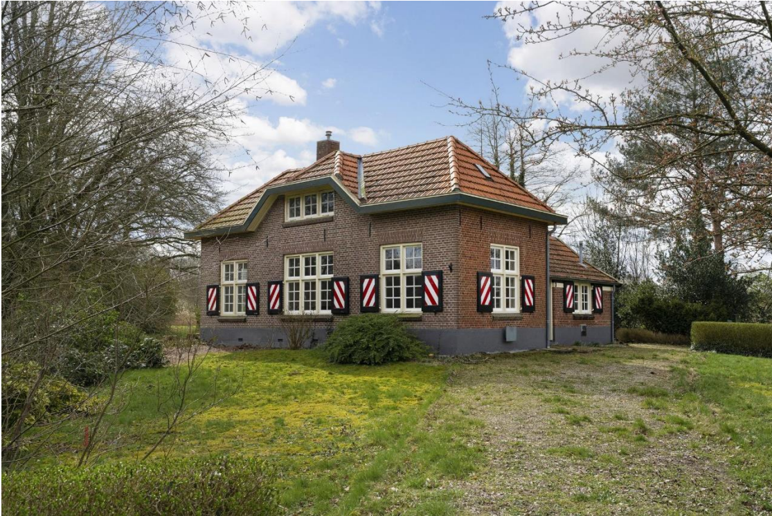
Voormalige chauffeurswoning Lochemseweg 3 in Diepenheim.