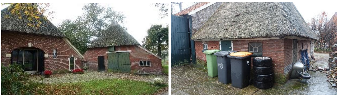
Vooroverleg VAB schuren mogelijk geschikt voor bewoning.